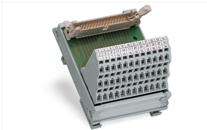
ilustracja podobnego produktu